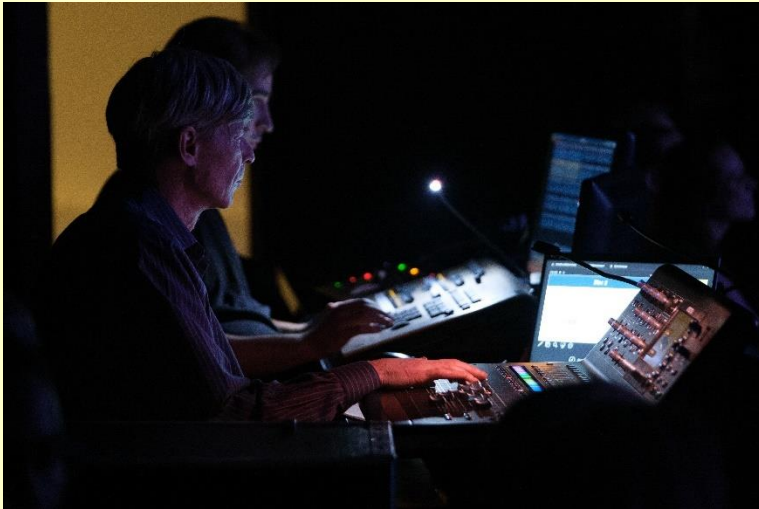
Les techniciens du son et de l'éclairage s'affairent à rendre le Gala spectaculaire.