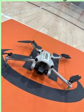
Formation en pilotage de drone