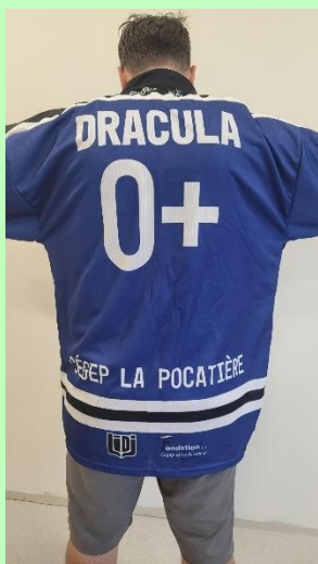
L'un des chandails de la ligue d'impro