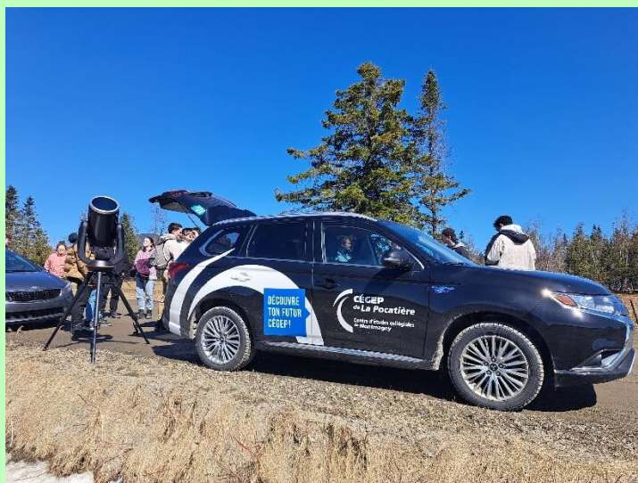
Observation de l'éclipse solaire le 8 avril 2024